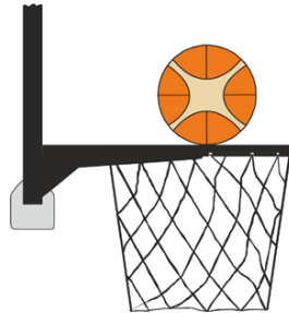
Figure 2 : Ballon en contact avec l'anneau

Une intervention illégale est commise par un joueur défenseur ou attaquant si, lors d'un tir au panier, un joueur touche le panier (l'anneau ou le filet) ou le panneau alors que le ballon est en contact avec l'anneau et qu'il a encore une chance de pénétrer dans le panier.