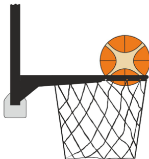
Figure 3 : Ballon à l'intérieur du panier

Il y a violation pour intervention illégale si un joueur défenseur touche le ballon quand il est à l'intérieur du panier.