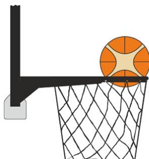
Figure 3 : Ballon dans le panier

Il y a violation pour intervention illégale si un joueur défenseur touche le ballon quand il est dans le panier.