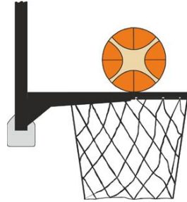
Figure 2 : Ballon en contact avec l'anneau

Il y a intervention illégale par un joueur défenseur ou attaquant si, lors d'un tir au panier, un joueur touche le panier ou le panneau alors que le ballon est en contact avec l'anneau et qu'il a encore la possibilité de rentrer dans le panier.